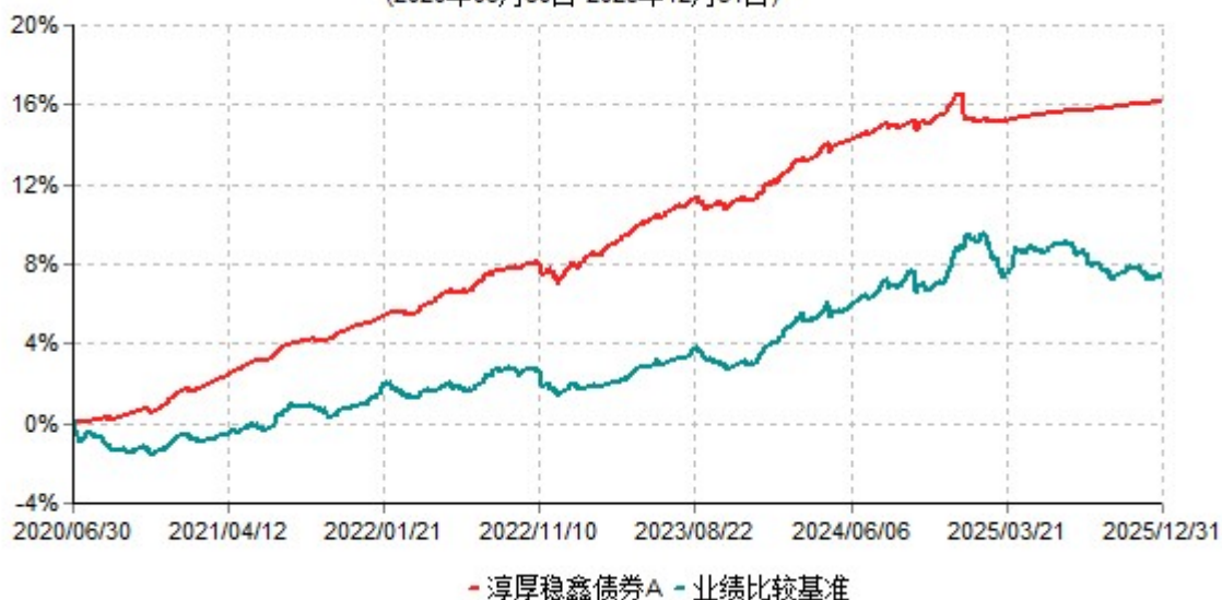
淳厚稳鑫债券A累计净值增长率与业绩比较基准收益率历史走势对比图 (2020年06月30日-2025年12月31日)

注：本基金基金合同生效日为2020年6月30日。按基金合同规定，本基金自基金合同生效起6个月内为建仓期。建仓期结束时本基金的各项投资比例均符合基金合同约定。