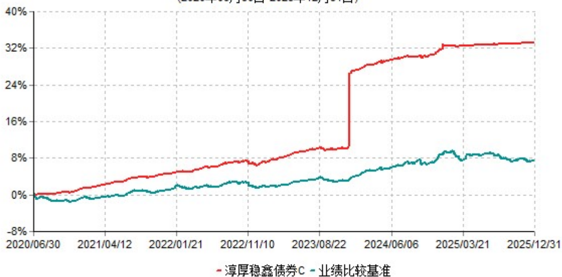
淳厚稳鑫债券C累计净值增长率与业绩比较基准收益率历史走势对比图 (2020年06月30日-2025年12月31日)

注：本基金基金合同生效日为2020年6月30日。按基金合同规定，本基金自基金合同生效起6个月内为建仓期。建仓期结束时本基金的各项投资比例均符合基金合同约定。